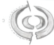
Şekil 1: Yaban Domuzu Erkek Bireyinde Diş Uzunluğunun Belirlenmesi