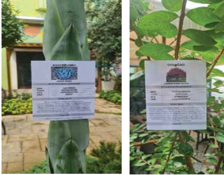
2.Biyοçeşitlilik bitki tanıtım çalışması