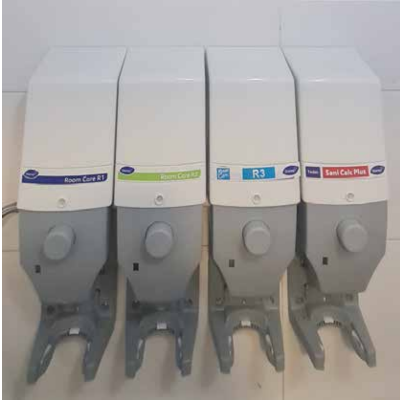
4-Kimyasal Dozajlama Sistemi