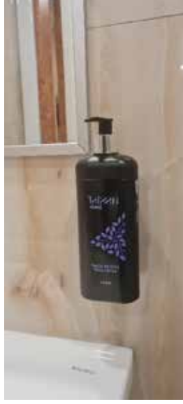
3.Odalarda ve genel wc lerde uzun süreli sıvı sabun dispenseri.