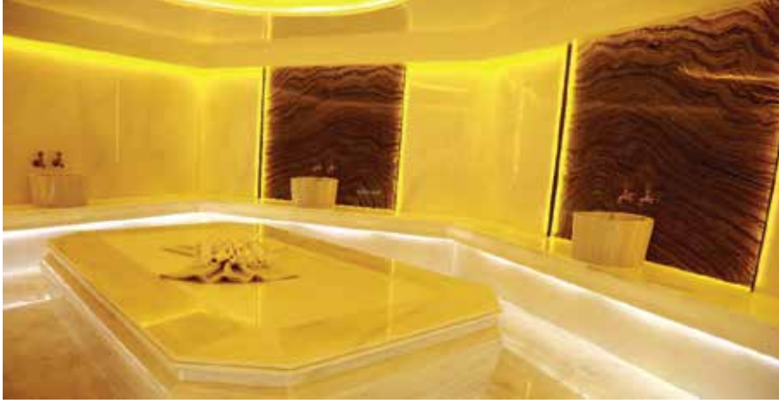
6. Türk Hamamı Görseli

Ayrıca somut ve somut olmayan kültürel mirasın korunması ve yaşatılması kapsamında Türk Hamamı'nın tarihi, mimari, işlevsel ve geleneksel boyutlarını görmeniz mümkündür.